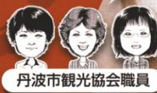
丹波市観光協会職員

お問い合わせ先 丹波市観光協会 TEL(0795)72-2340 丹波県民局 TEL(0795)73-3782